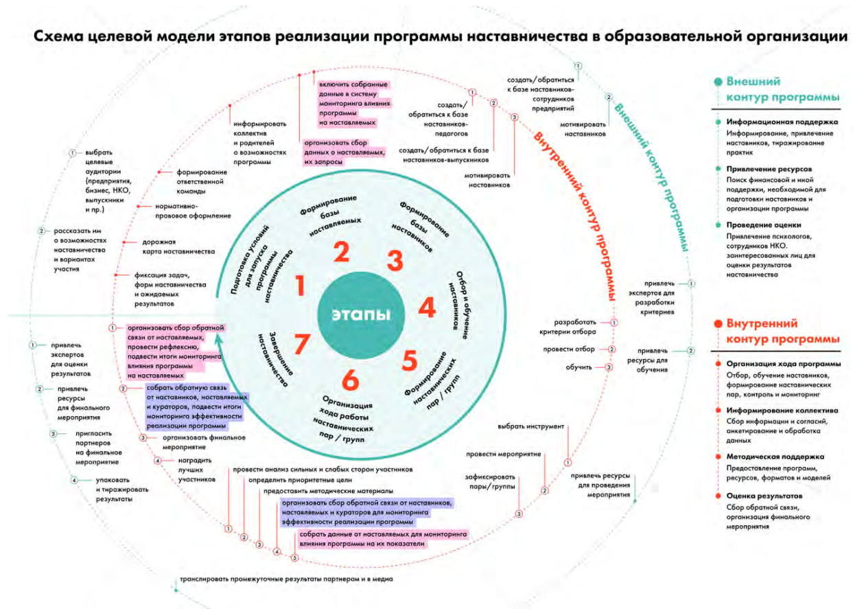
Рис. 6. Схема целевой модели этапов реализации программы в образовательной организации

Содержание каждого этапа, представленное в виде направлений работы с внутренним и внешним контурами, содержится в таблице 1 «Целевая модель этапов реализации программы наставничества в образовательной организации». В таблице 2 «Целевая модель программы наставничества в образовательной организации» представлены основные компоненты программы наставничества.