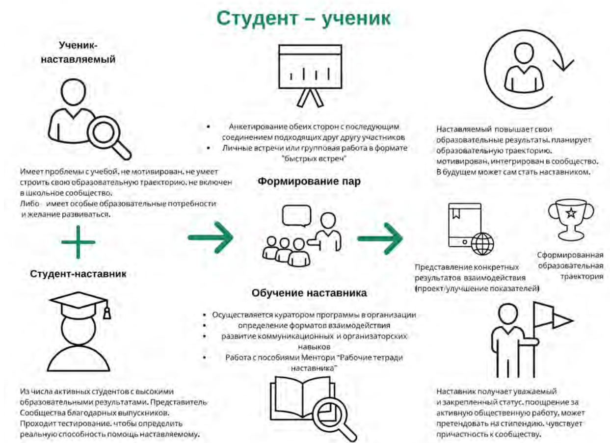
Рисунок 3. Графическое представление реализации программы наставничества по форме «студент – ученик».