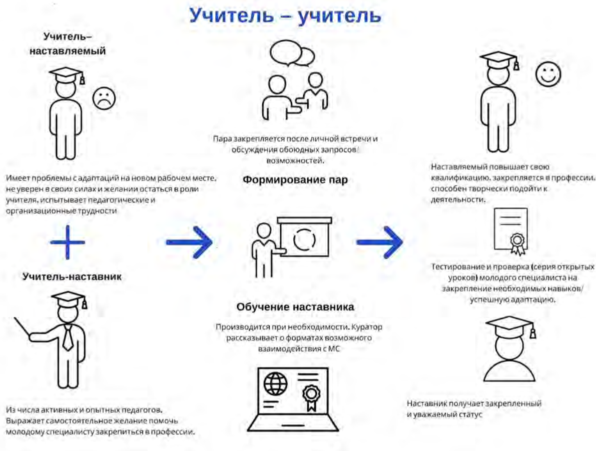
Рисунок 2. Графическое представление реализации программы наставничества по форме «ученик – ученик».