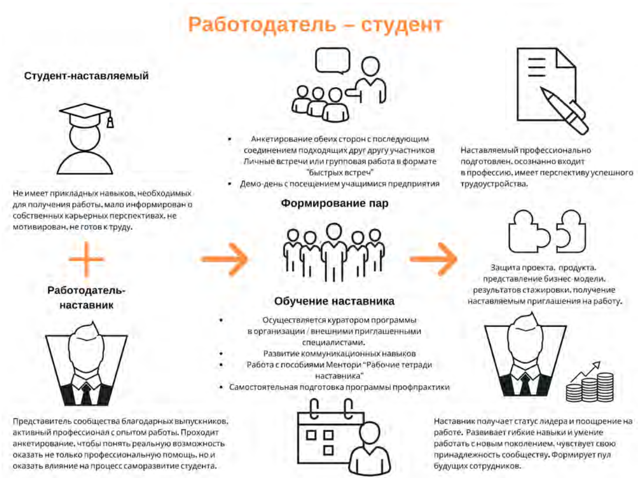
Рисунок 5. Графическое представление реализации программы наставничества по форме «работодатель – студент».