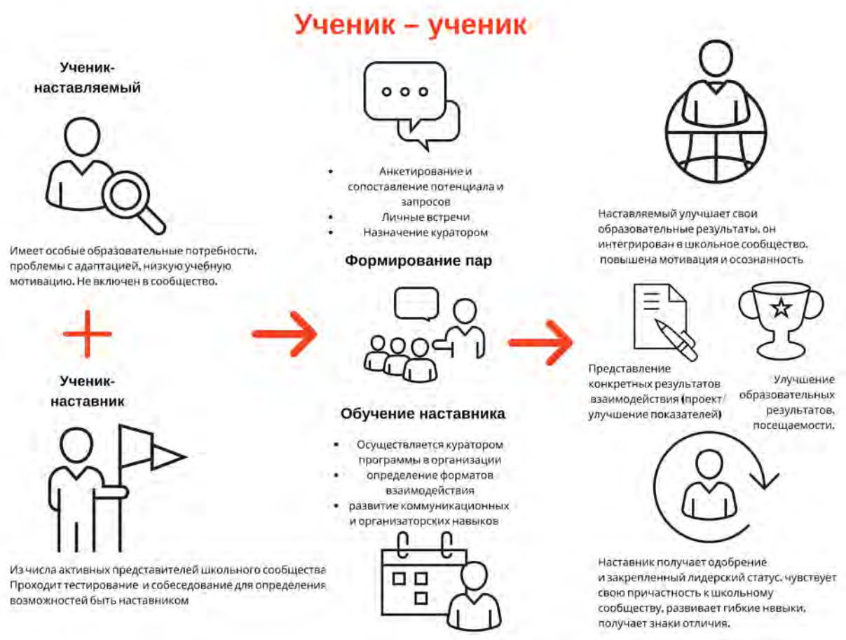
Рисунок 1. Графическое представление реализации программы наставничества по форме «ученик – ученик».